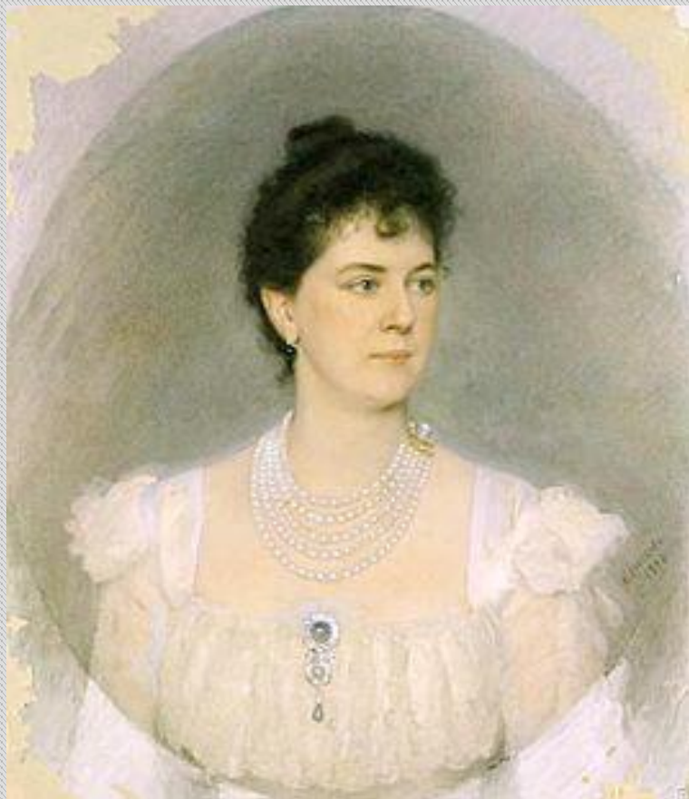
Мария Клавдиевна ТЕНИШЕВА (1858-1928)