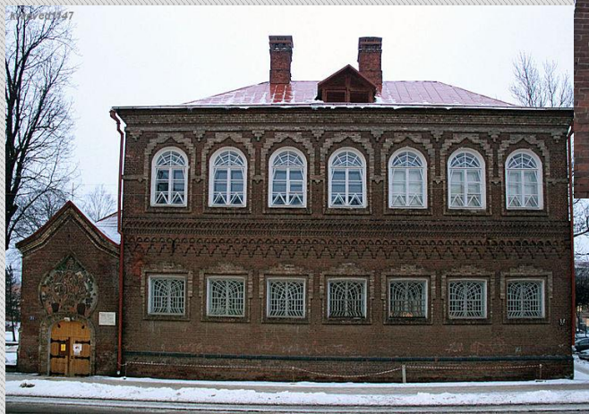
Здание музея «Русская старина» в Смоленске