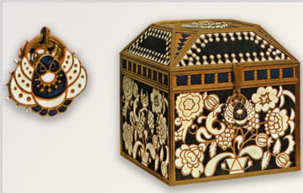
Сундук и подвеска, инкрустированные выемчатой эмалью. Работа М.К.Тенишевой

Она основывает специальную художественную школу в Смоленске. Мастера, которые учатся в ней, начинают оформлять церковь, построенную на средства семьи Тенишевых во Фленове.