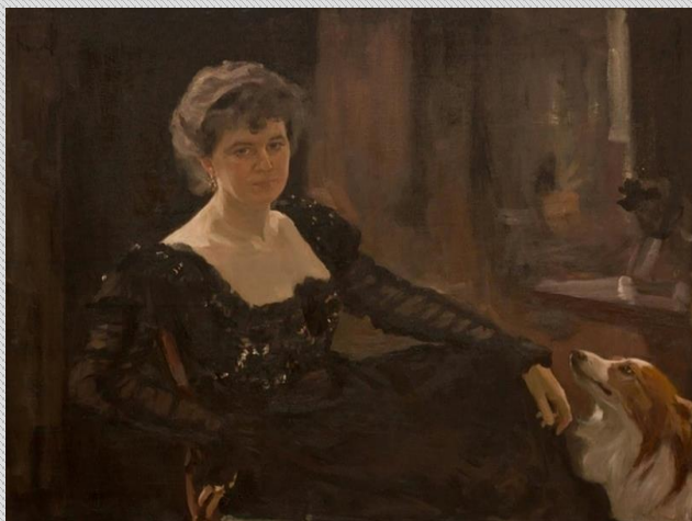
В.А.Серов. Портрет княгини М.К.Тенишевой.

Впоследствии эта коллекция составила основу первого в стране Музея русского декоративно-прикладного искусства «Русская старина», который в 1911 был передан княгиней в дар Смоленску.