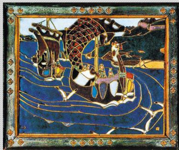
«Заморские гости». Эскиз для этой эмали был сделан Н. К. Рерихом