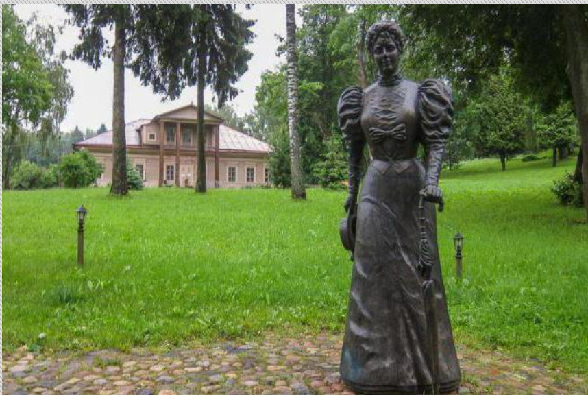
Памятник М.К. Тенишевой во Фленове Смоленской области

Тенишева скончалась 14 апреля 1928 г. в парижском пригороде Сен-Клу. В некрологе, посвящённом Марии Клавдиевне, И. Я. Билибин писал: «Всю свою жизнь она посвятила родному русскому искусству, для которого сделала бесконечно много».