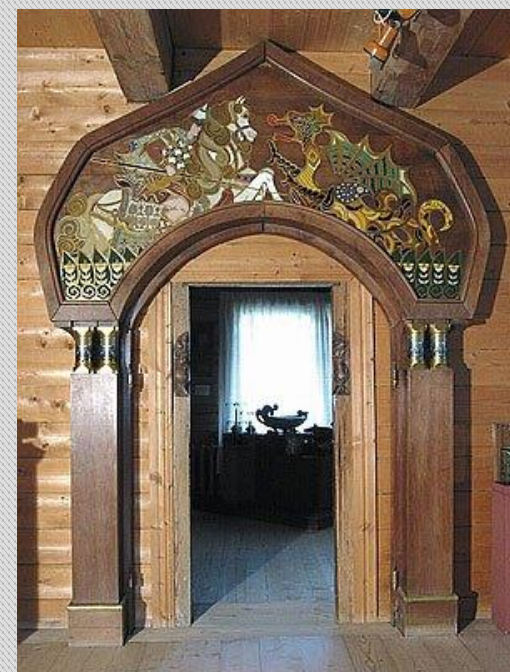
Портал «Георгий Победоносец» работы М.К.Тенишевой. Дерево, эмаль