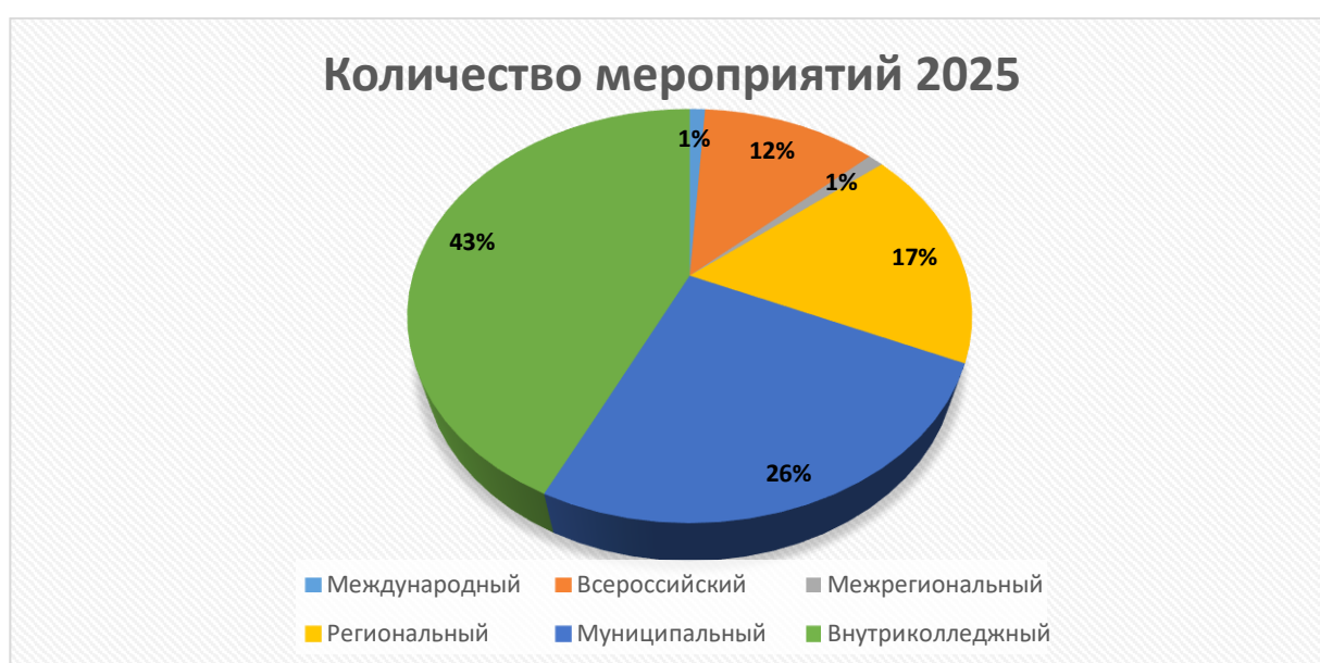
Рис.1. Количественные показатели мероприятий различных уровней, в которых принимали участие студенты в 2025 учебном году

Диаграмма отчетливо демонстрирует числовые значения, отражающие участие студентов колледжа в событиях различного масштаба, проходивших в течение 2025 учебного года.