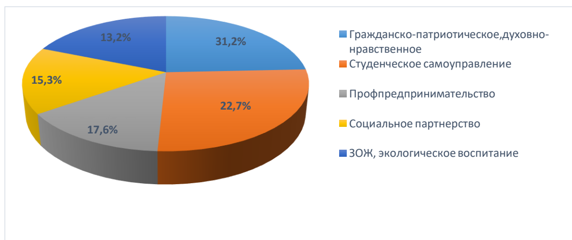
Рис.2 Результаты мониторинга проведенных мероприятий по каждому направлению воспитательной деятельности.

На рисунке 2 отражены итоги анализа реализованных мероприятий по различным направлениям воспитательной работы.